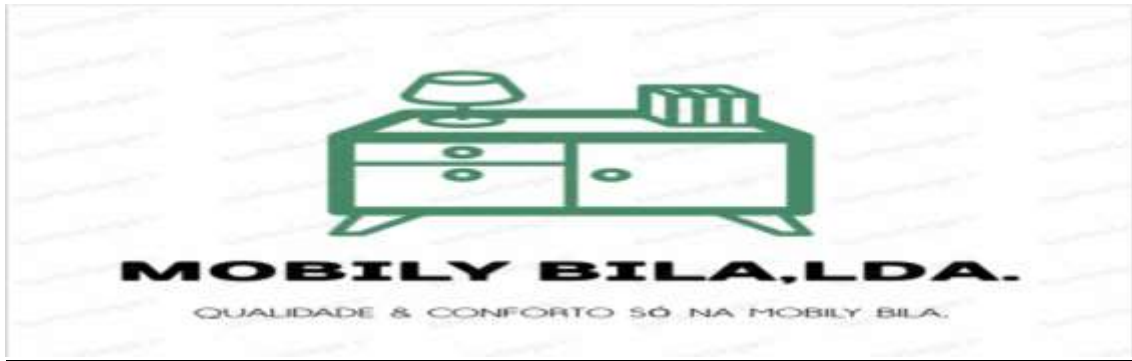
Figura 1: Logótipo da empresa